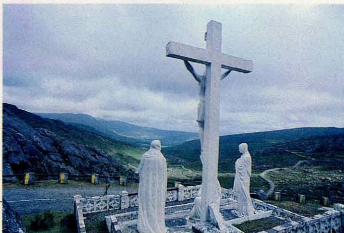
Beeld voor de hongerende wegenbouwers van Healey's Pass.

blauwe zee zien en in de verte Bantry Bay en het kale grijze Caha-gebergte van het schiereiland Beara.