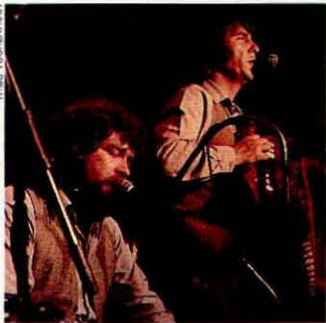
Spontane muziek in de pubs: heel gewoon.

Bij Caherdaniel slaan de golven woest op de kust. De gekleurde bootjes onderaan de rotsen dansen wild op en neer. De zeevogels boven mijn hoofd krijsen en halen acrobatische toeren uit.