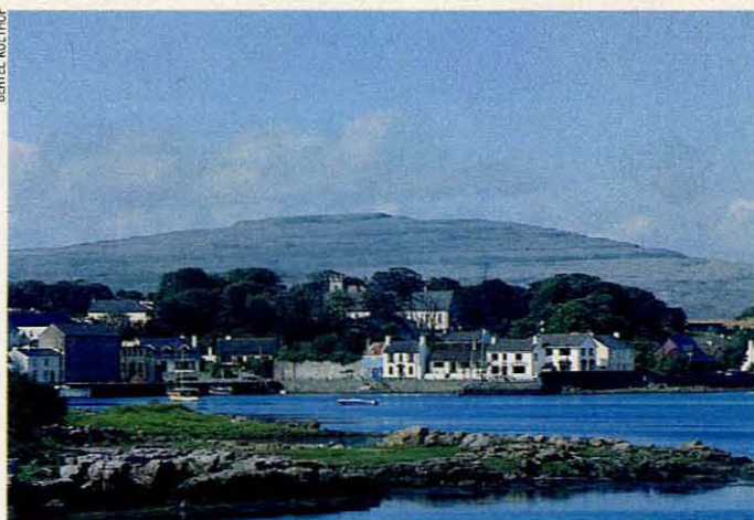
Lekker vis eten (boven) of wandelen in het Caha gebergte op Beara.