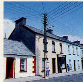
Vrolijke huizen in een groen land.

Na de bijna exotische omgeving van Bantry wordt het tijd om het ruigere Ierland op te zoeken. Mijn gastvrouw raadt aan niet meteen naar de bekende 'Ring of Kerry'