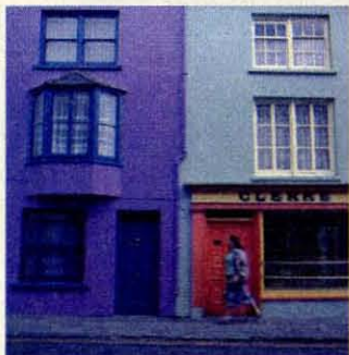
Kleurrijke schemer in Tralee.

meters grijze kalksteen, doorploegd met diepe kloven, onderbroken door stenen muurtjes. De opzichters die de Engelse regent Oliver Cromwell in de zeventiende eeuw naar de Burren stuurde, kwamen terug met het bericht dat het een woest gebied was 'met nog geen water om een man te verdrinken, geen boom om hem aan op te hangen en geen genoeg aarde om hem te begraven'. Alles is van steen: velden, muurtjes, een enkel huis.